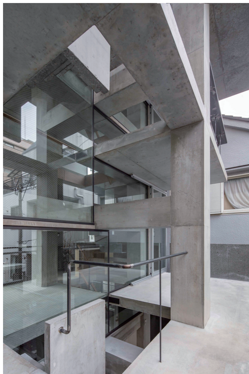
古澤大輔/リライト_D + 日本大学理工学部古澤研究室<古澤邸> (2019)